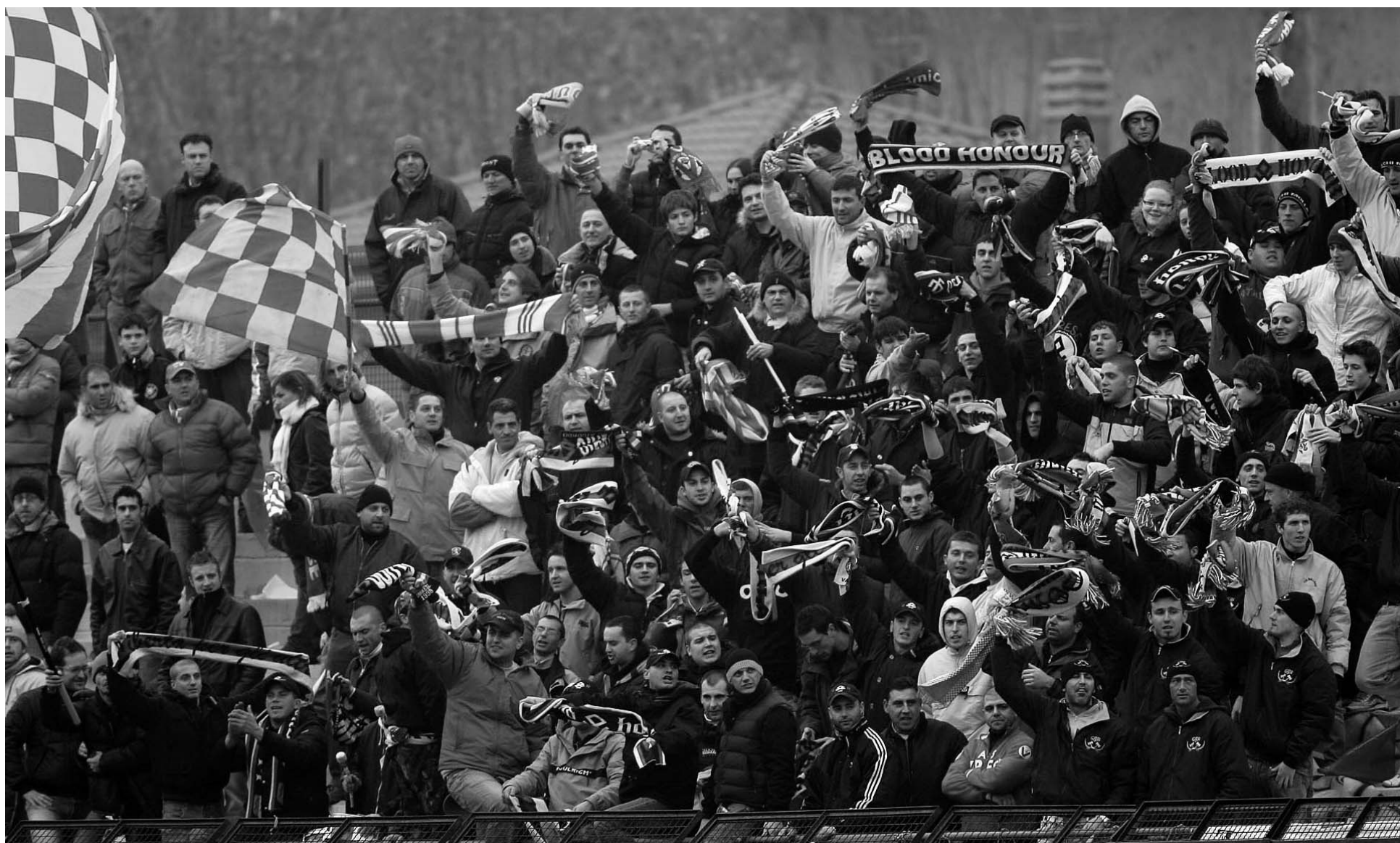
Il Varese domenica al F. Ossola ha bisogno del suo pubblico. Un pubblico che inciti la squadra dal primo al novantesimo e poi... si vedrà

SECONDA SCONFITTA CONSECUTIVA per il Varese che in Sardegna gioca bene ma non riesce ad ottenere punti. Il pari sarebbe stato un risultato più equo, visto quanto accaduto sul terreno di gioco, ma alla fine la spunta la formazione sassarese. Tutto si decide nei primi venti minuti. In apertura di incontro Guariniello si inserisce nella disunita difesa